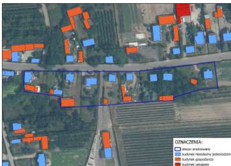
Rysunek 2. Teren zagospodarowany pod zabudowę mieszkaniową jednorodziną na terenie Gminy Goszczyn