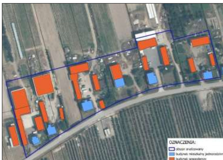
Rysunek 3. Teren zagospodarowany pod zabudowę zagrodową na terenie Gminy Goszczyn