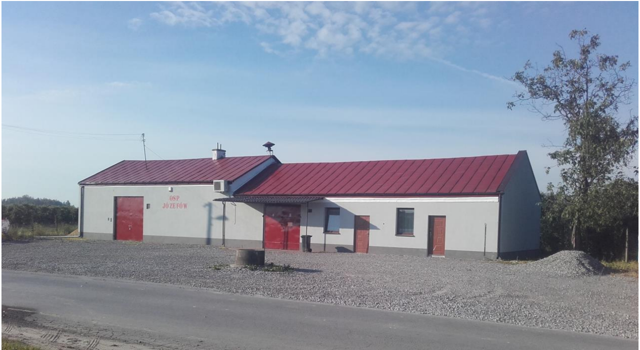
Fot.: Remiza OSP w Józefowie