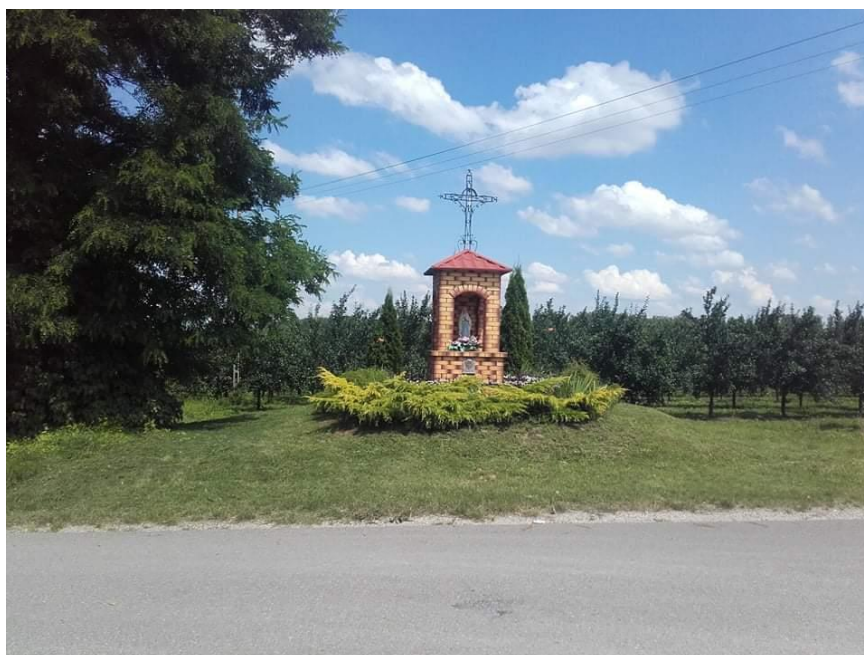
Fot. Kapliczka w Józefowie

Potencjalnie do listy obiektów kulturowych mogą zostać zaliczone pozostające własnością prywatną tradycyjne domy o konstrukcji drewnianej oraz kapliczki przydrożne.