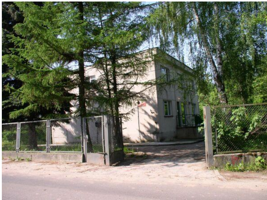
Fot.: Ośrodek zdrowia w Goszczynie

Podstawowej w Goszczynie oraz Przedstawiciel Wojewody Mazowieckiego. Aby zapewnić jak najlepsze warunki i opiekę medyczną pacjentom zdecydowano o termomodernizacji budynku Ośrodka Zdrowia, która obecnie trwa, a jej zakończenie zaplanowane jest w II połowie 2022 roku. Również najbliższa apteka obsługująca mieszkańców znajduje się w Goszczynie. Apteka pracuje 6 dni w tygodniu i zatrudnia magistrów farmacji.