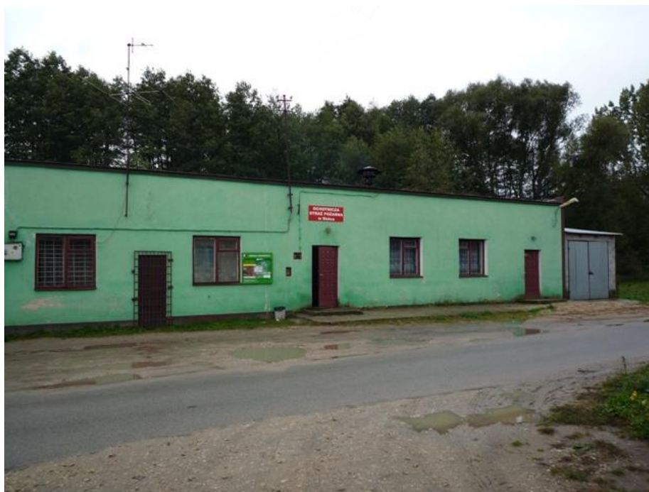
Fot.: Remiza OSP w Sielcu

W ciągu ostatnich lat Ochotnicza Straż Pożarna w Sielcu wzbogaciła się o sprzęt strażacki i umundurowanie, które zostały zakupione z dotacji Urzędu Marszałkowskiego. W 2021r. wykonano modernizację garażu Ochotniczej Straży Pożarnej w Sielcu.