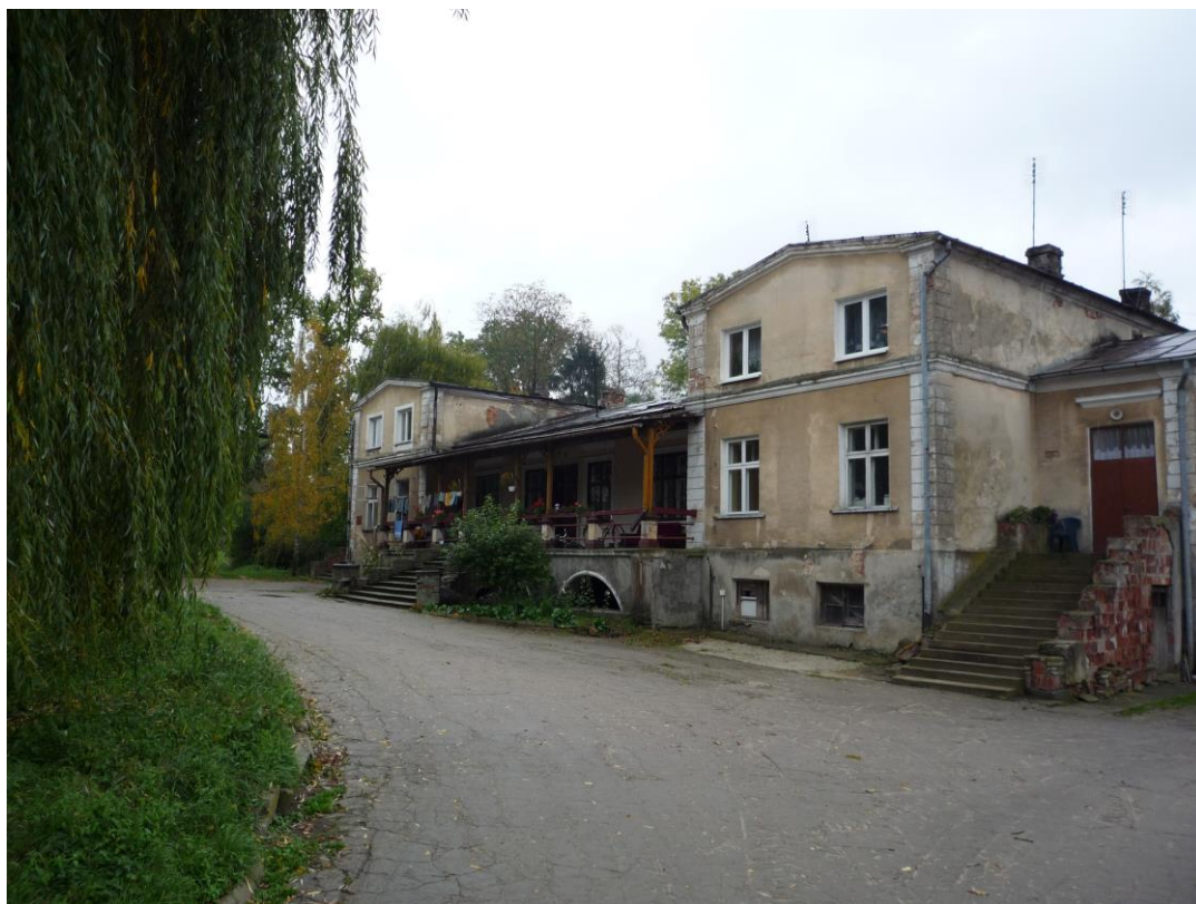
Fot. Dworek w Sielcu