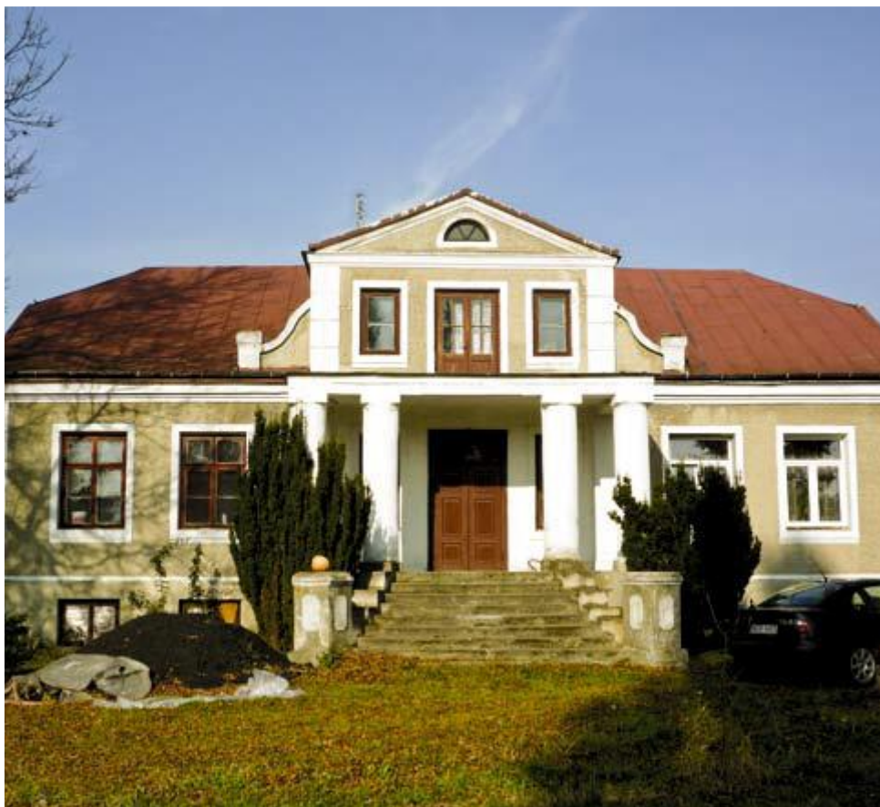
Fot. Dwór w Sielcu (Tąkiele) z XX w.

W parku dworskim w Sielcu rośnie dąb szypułkowy w wieku ok. 350 lat uznany za pomnik przyrody. Wiekowe drzewo ma wysokość 24 metry i obwód pnia 505 cm. Dopełnieniem krajobrazu jest przepiękna, długa sięgająca do miejscowości Goszczyn aleja kasztanowa z czasów świetności dworu.