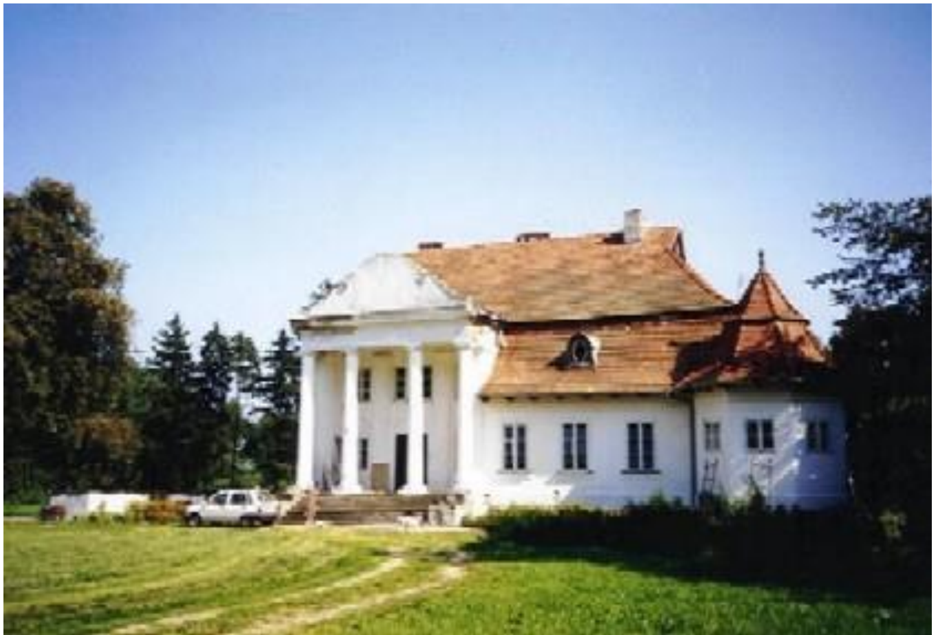
Fot. Dworek w Dylewie

Produkcję o zdecydowanym profilu sadowniczym, starania o odnowę terenów zielonych, czyste środowisko, możliwość budowy zbiornika wodnego i renowacja rowu T – 13 znajdującego się na terenie sąsiadującej z Sielcem miejscowości Goszczyn oraz korzystny mikroklimat są podstawami do rozwoju agroturystyki na terenie Sielca.