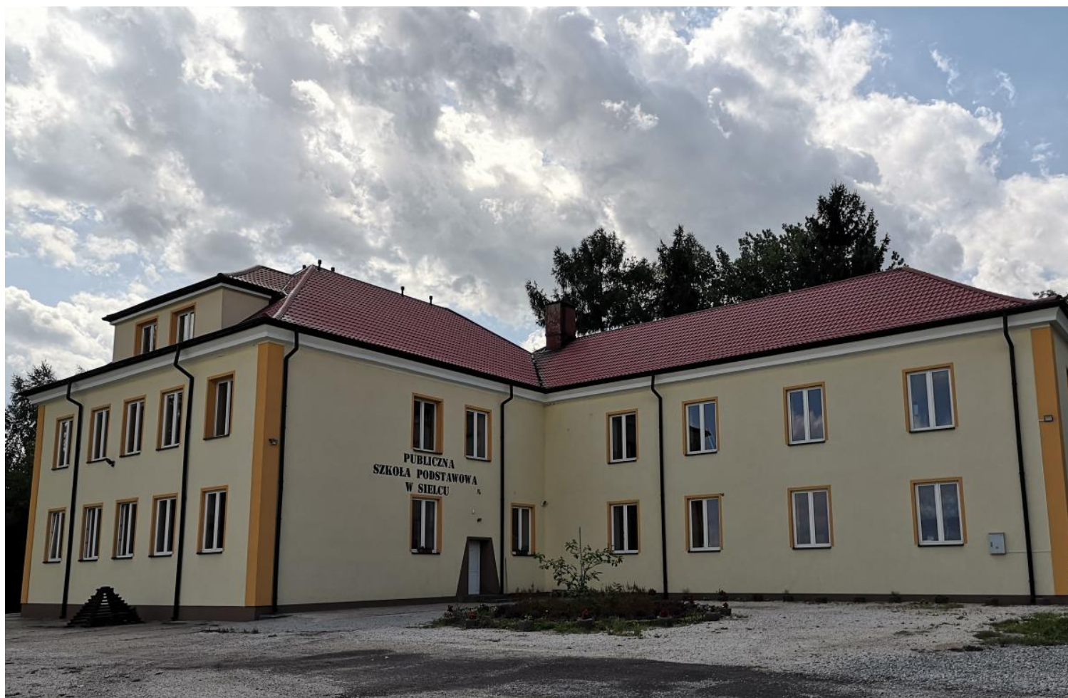
Fot.: Budynek PSP Sielec