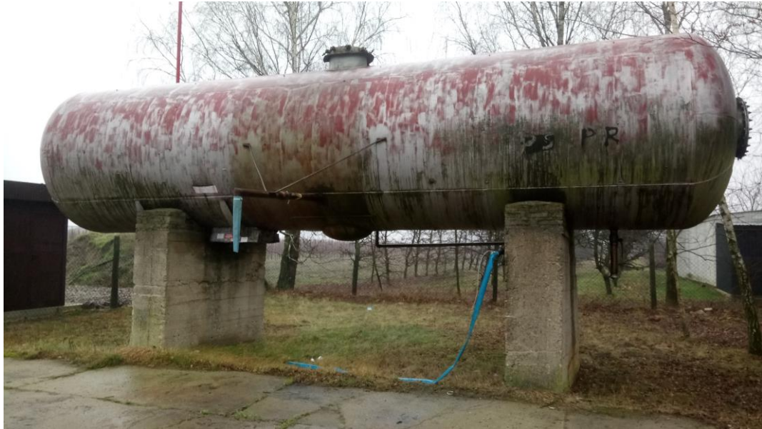
Fot. Ujęcie wody