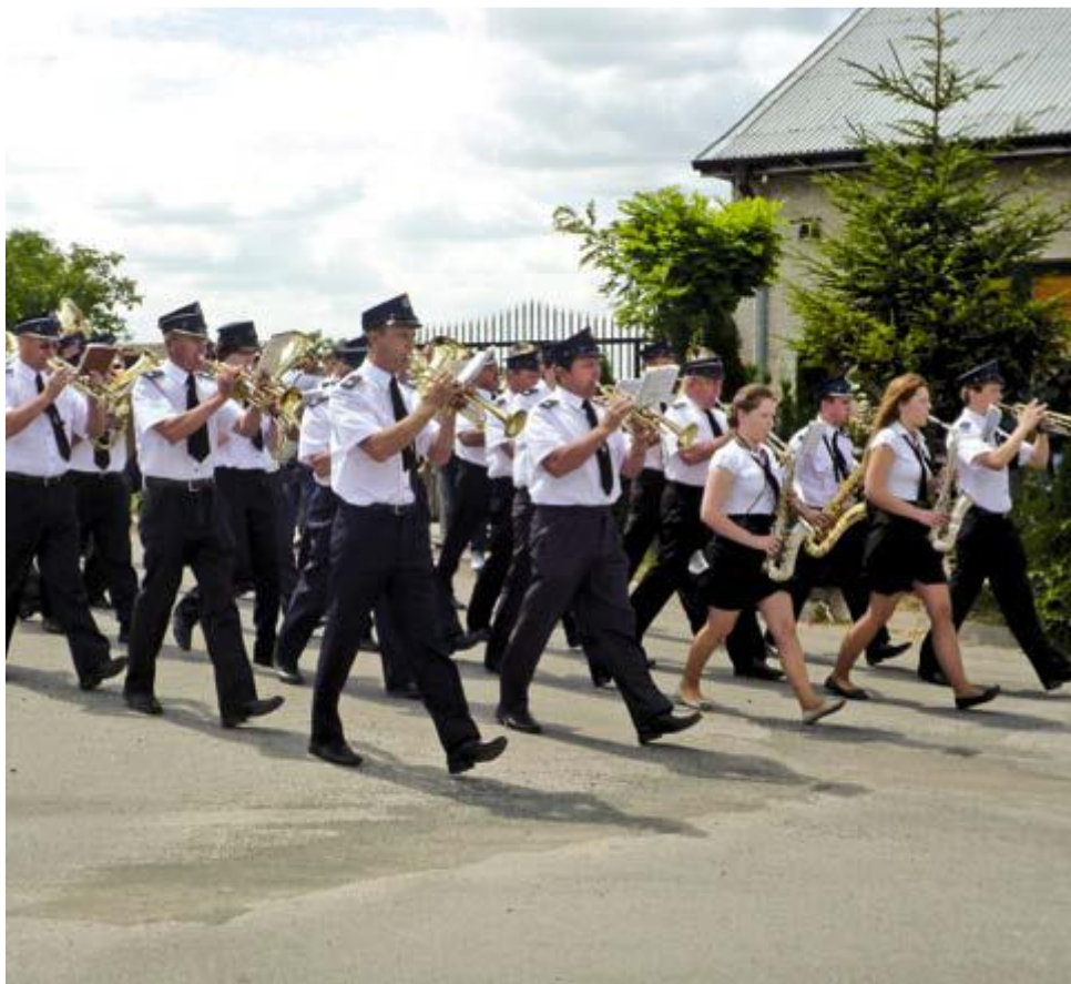
Fot. Orkiestra dęta

W styczniu 2019 roku orkiestra dęta w Olszewie obchodziła 45 – lecie swojej działalności.