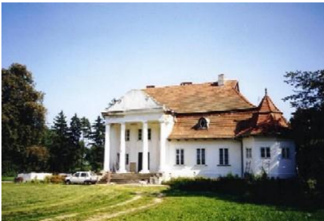
Fot. Dworek w Dylewie