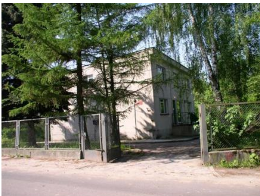
Fot.: Ośrodek zdrowia w Goszczynie

Również najbliższa apteka obsługująca mieszkańców znajduje się w Goszczynie. Apteka pracuje 6 dni w tygodniu i zatrudnia magistrów farmacji.