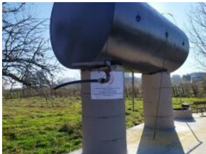
Fot. Beczka na wodę w Modrzewinie

Jedyną własnością gminną znajdujących się na terenie Modrzewiny jest beczka na wodę, którą zmodernizowano w 2021 r. W ramach zadania „Zagospodarowanie terenu sołectwa Modrzewina” wykonano renowację beczki na wodę poprzez czyszczenie i malowanie, wymieniono instalację elektryczną, wykonano remont wjazdu poprzez korytowanie rowu oraz zalanie nawierzchni betonem, a także zakupiono i zamontowano ławeczki i kosz na śmieci.