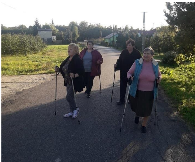
Fot. Seniorki z Modrzewiny

W Modrzewinie działają bardzo prężnie Aktywni Seniorzy z Modrzewiny, którzy są także członkami istniejącego w Goszczynie Klubu Seniora. W swoich działaniach mają na celu pobudzić społeczność do działalności kulturowej. Seniorzy chętnie się spotykają i wspólnie spędzają czas, ucząc się nowych ciekawych rzeczy. Biorą udział w różnego rodzaju warsztatach kulinarnych, wykonują własnoręcznie dekoracje świąteczne oraz inne ozdoby i rękodzieła.