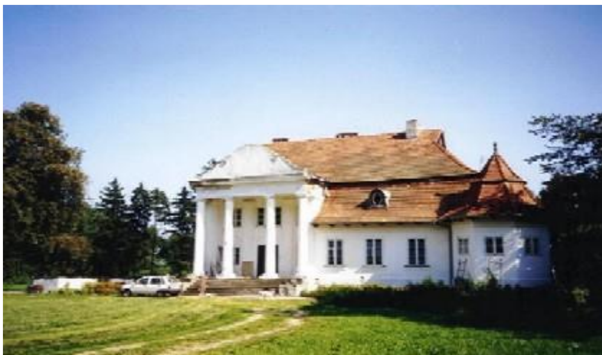
Fot. Dworek w Dylewie