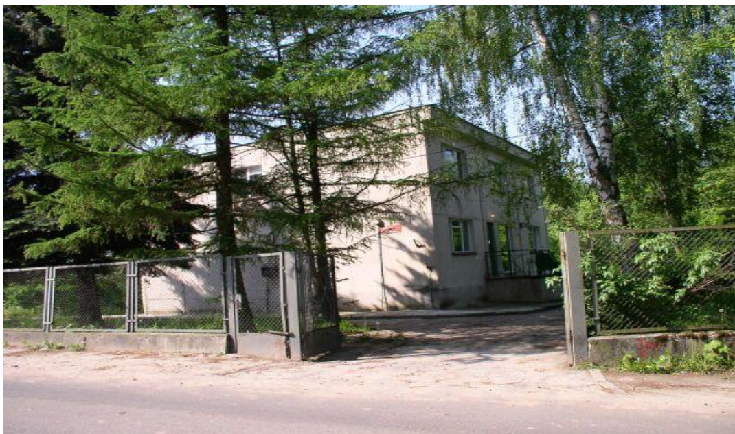
Fot.: Ośrodek zdrowia w Goszczynie

Również najbliższa apteka obsługująca mieszkańców znajduje się w Goszczynie.