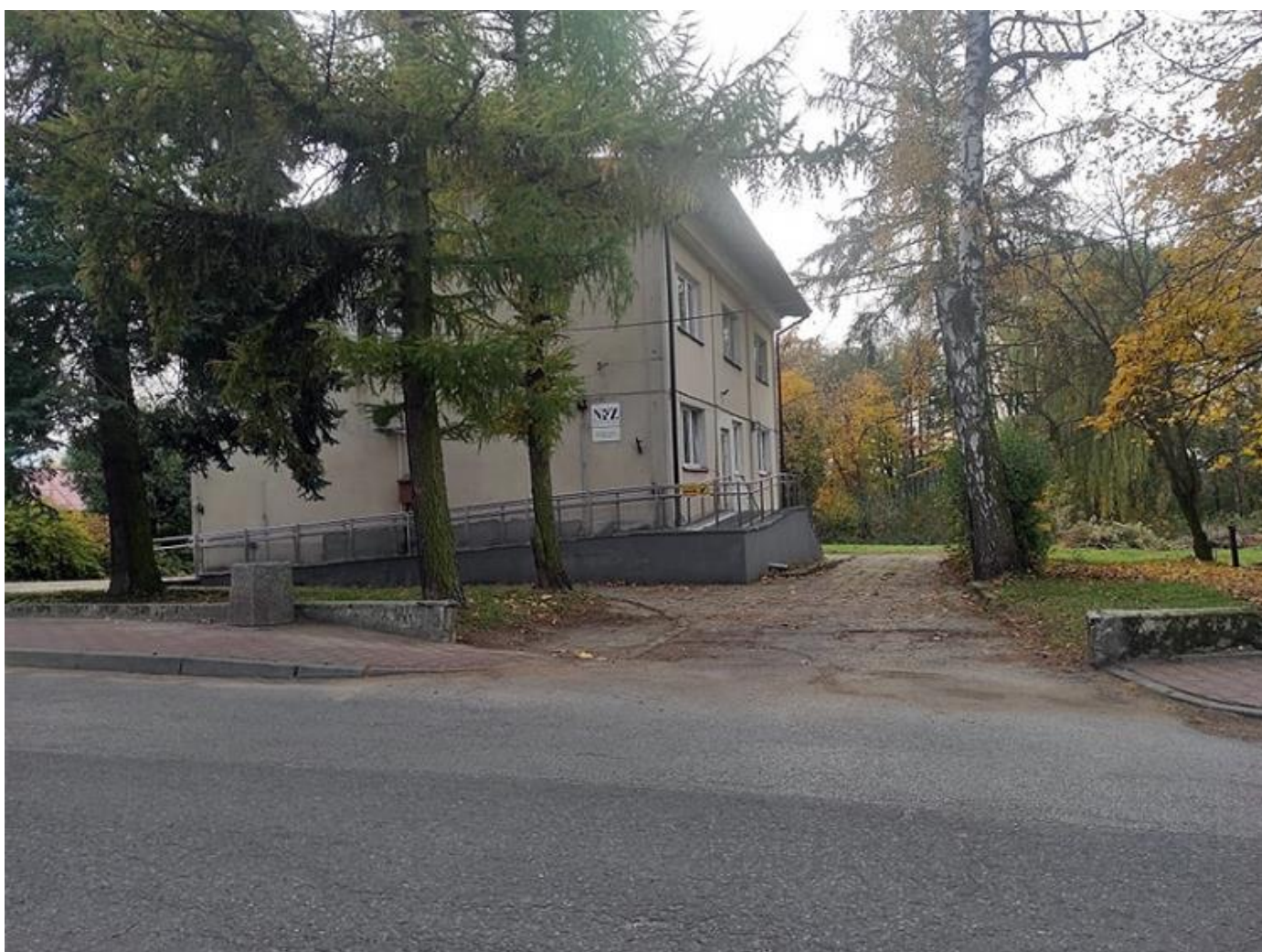
Fot.: Ośrodek zdrowia w Goszczynie

We wsi Jakubów nie ma Zakładu Opieki Zdrowotnej. Najbliższą placówką medyczną jest znajdujący się w Goszczynie Samodzielny Publiczny Zakład Opieki Zdrowotnej. Przy Samodzielnym Publicznym Zakładzie Opieki Zdrowotnej w Goszczynie działa 5 osobowa Rada Społeczna. Rada została powołana 18 marca 2019 r. W skład Rady wchodzi: Wójt Gminy, Przewodniczący Rady Gminy, Kierownik GOPS w Goszczynie, Dyrektor Publicznej Szkoły Podstawowej w Goszczynie oraz Przedstawiciel Wojewody Mazowieckiego. Również najbliższa apteka obsługująca mieszkańców znajduje się w Goszczynie.