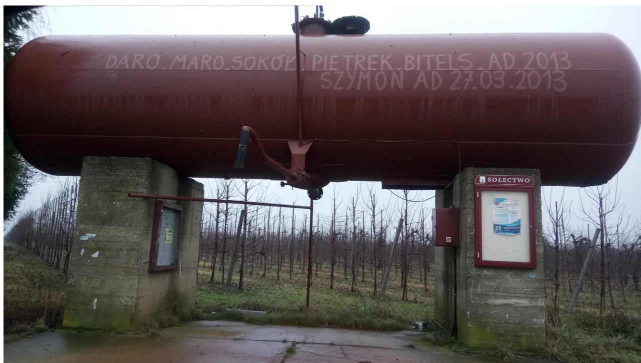
Fot. Ujęcie wody

W Jakubowie znajduje się działka gminna nr 35/1 o powierzchni 0,0102 z beczką na wodę do celów zabiegów chemicznych sadów.