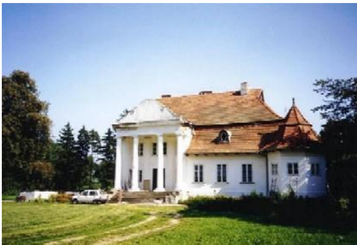
Fot. Dworek w Dylewie