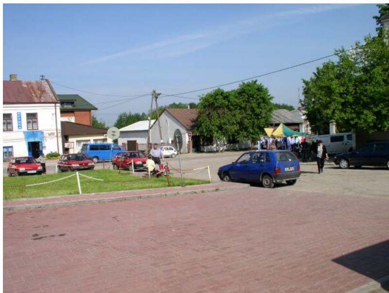
Fot.: Rynek Goszczyna

Goszczyn szczyci się historią sięgającą średniowiecza. O jego świetności i znaczeniu dowiadujemy się jedynie z przekładów pisemnych. Patrząc na dzisiejszy Goszczyn – trudno dopatrzeć się dawniejszej świetności miasta. Dziś osada rolnicza, leżąca w powiecie grójeckim, oddalona od Warszawy o około 60 km. Wraz z rozwojem Warszawy zamienionej na stolicę, gdzie po wojnach szwedzkich skoncentrowała się ludność, przemysł i handel, wiele miast mazowieckich traciło na znaczeniu, a wśród nich i Goszczyn.