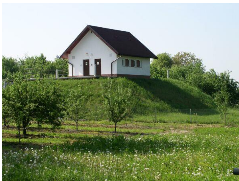
Fot.: Oczyszczalnia ścieków w Goszczyńie

Oczyszczalnia ścieków o wydajności 174 m 3 /d mieszcząca się w Goszczyńie oddana do użytku w 2002 r. Obiekt ten znajduje się w bardzo dobrym stanie technicznym. Jest parterowy, otynkowany, doprowadzona jest do niego energia elektryczna.