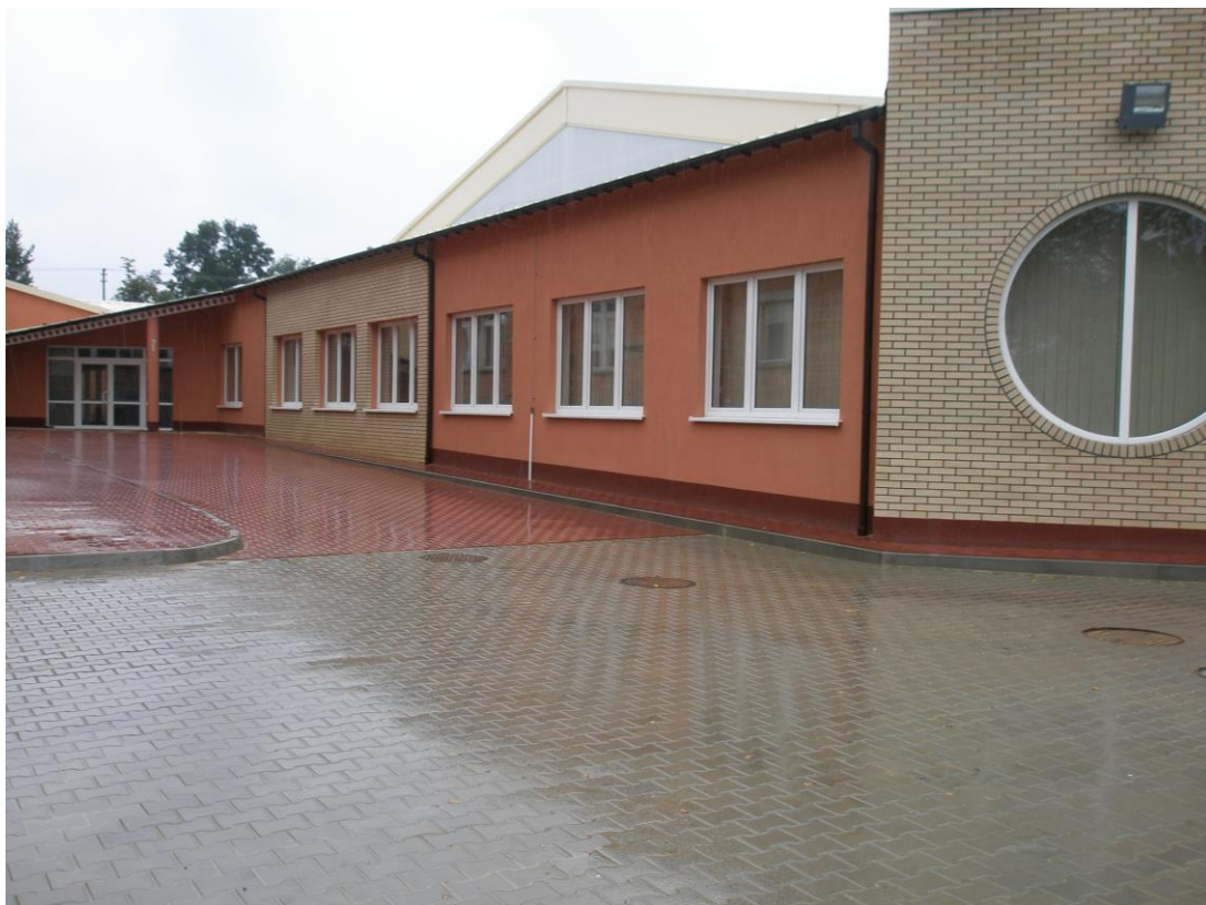
Fot.: Budynek sali sportowej