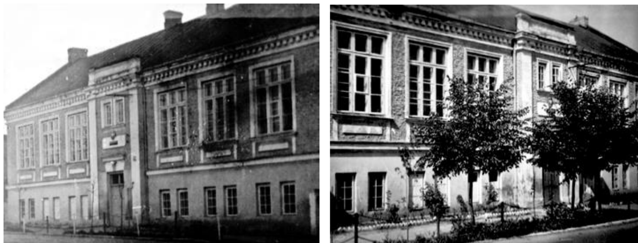
Fot. Budynek starej szkoły przy ul. Przybyszewskiej (1975 r.)

W 2008 r. wykonano termomodernizację całego budynku szkolnego.