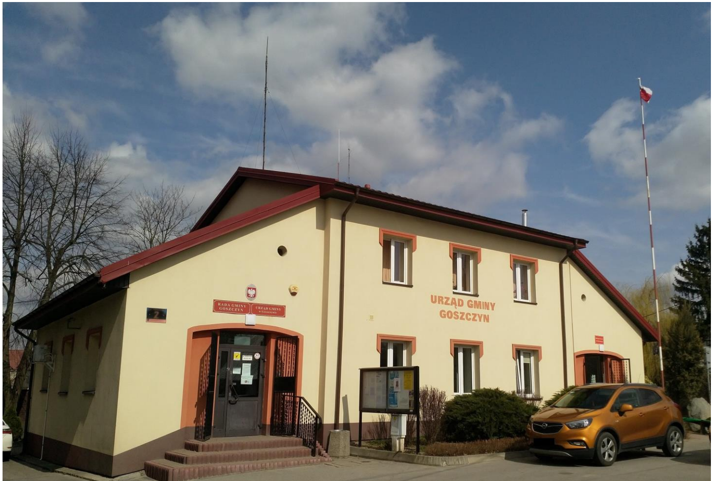
Fot.: Budynek Urzędu Gminy Goszczyn

Budynek zlokalizowany jest przy ul. Bądkowskiej.