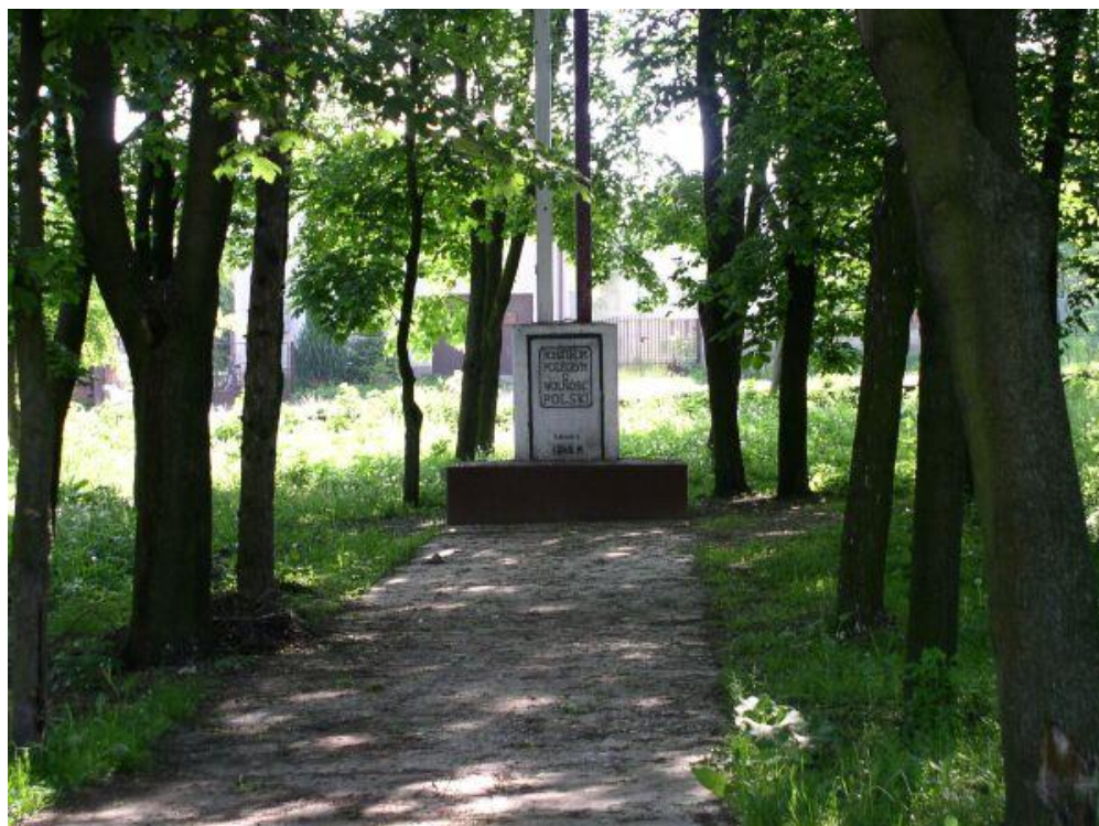
Fot.: Pomnik Bohaterów Poległych w Obronie Ojczyzny-dawniej

Po wojnie gmina dość szybko się rozwija. W 1946 roku powstają dwa punkty skupu owoców, w 1958 roku Lecznica Zwierząt. W 1947 roku zostało w Goszczyńcu zorganizowane Koło Gospodyń Wiejskich, a w 1951 roku uruchomiono „Wiejskie Kino Stałe”