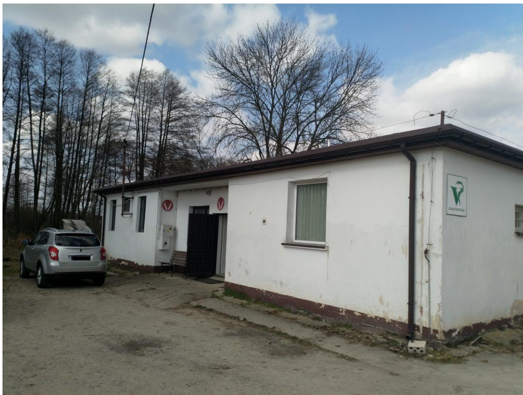
Fot.: Lecznica weterynaryjna na wprost