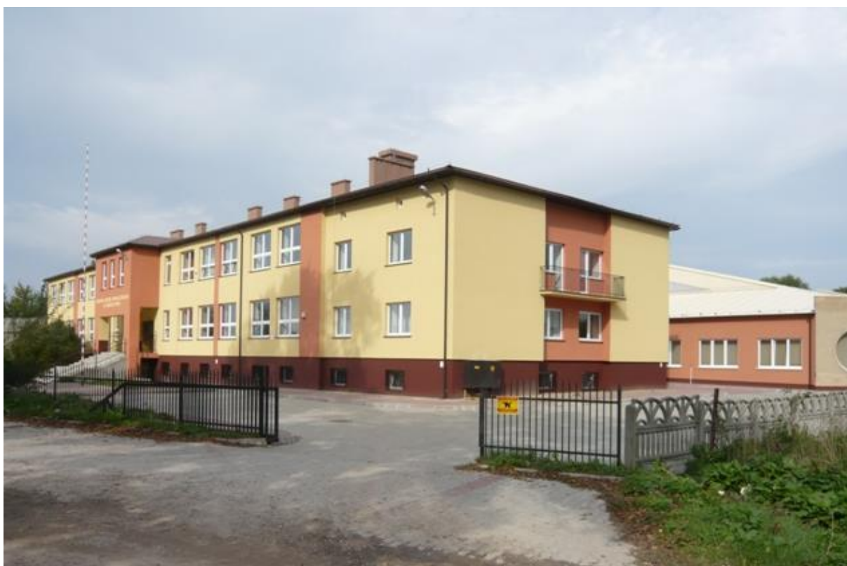
Fot. Budynek szkoły dziś

W 2012 roku oddany został do użytku obiekt sportowy przy PSP Goszczyn „Moje boisko – Orlik 2012, a w 2014 roku kolejna inwestycja - kompleks sportowo-rekreacyjny.