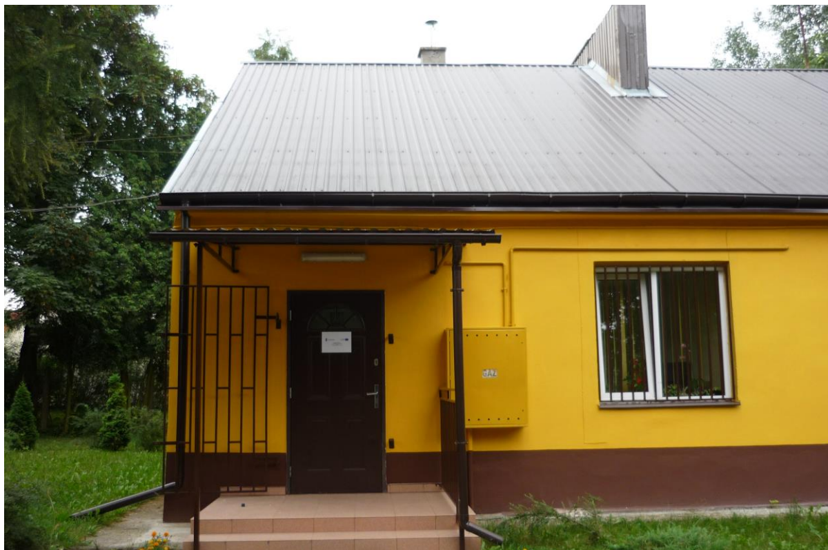
Fot.: Budynek Gminnego Ośrodka Pomocy Społecznej w Goszczyńie