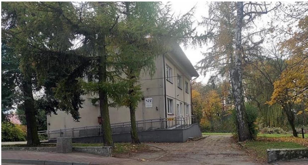
Fot.: Ośrodek zdrowia