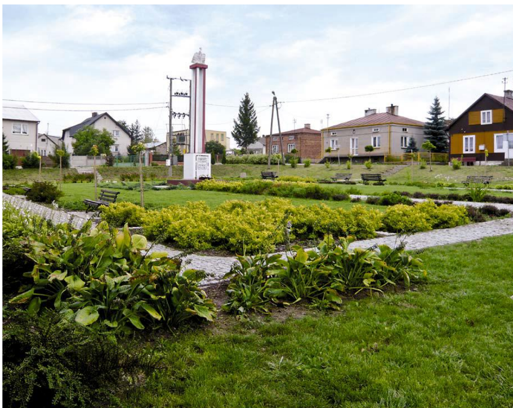
Fot.: Pomnik Bohaterów Poległych w Obronie Ojczyzny-dzisiaj