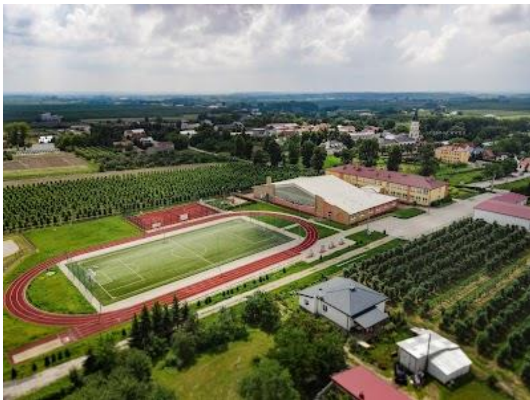
Fot. Kompleks boisk

Do istniejącego boiska „Orlik” została dobudowana bieżnia lekkoatletyczna, plac zabaw dla dzieci, rekreacyjny plac trawiasty, zewnętrzna siłownia i trybuny na 150 miejsc.