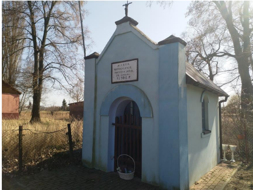
Fot: Kapliczka w Długowoli

W 1904 roku wybuchł wielki pożar, który strawił wszystkie domostwa, nie pociągając jednak za sobą żadnych ofiar w ludziach (wszyscy mieszkańcy uczestniczyli w przypadającym na dzień św. Antoniego odpuście w Przybyszewie). Wieś szybko odbudowano dzięki hojności cara Mikołaja II, który na wniosek Dall -Trozzego przydzielił drewno oraz pracowników do odbudowy. Od tego momentu dziedzic wielokrotnie podejmował próby utworzenia brygady przeciwpożarowej. Ostatecznym impulsem do jej stworzenia stał się pożar pamiętającego czasy jagiellońskie folwarku, który służył jako dwór myśliwski.