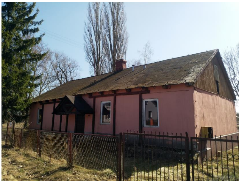
Fot: Budynek po szkole w Długowoli