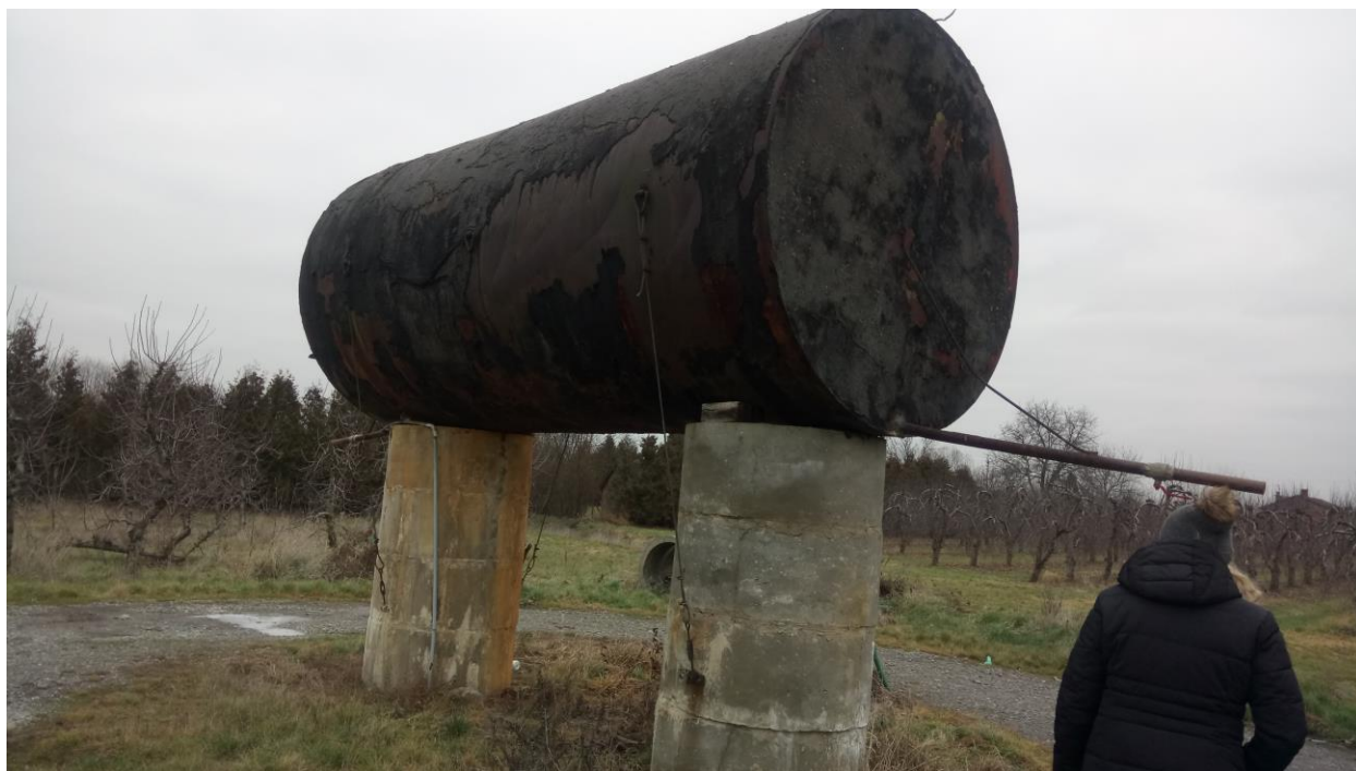
Fot. Ujęcie wody

W Długowoli znajduje się działka gminna nr 161/2 o powierzchni 0,0331 z beczką na wodę do celów zabiegów chemicznych sadów.