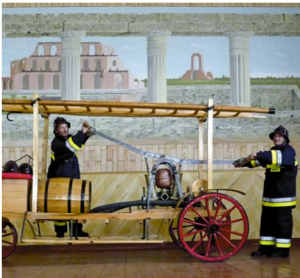
Fot. Konny wóz strażacki

rocznicę powstania OSP przekazał jednostce wóz strażacki. Podczas tej uroczystości strażacy-weterani zaprezentowali odrestaurowany sprzęt z czasów przedwojennych.