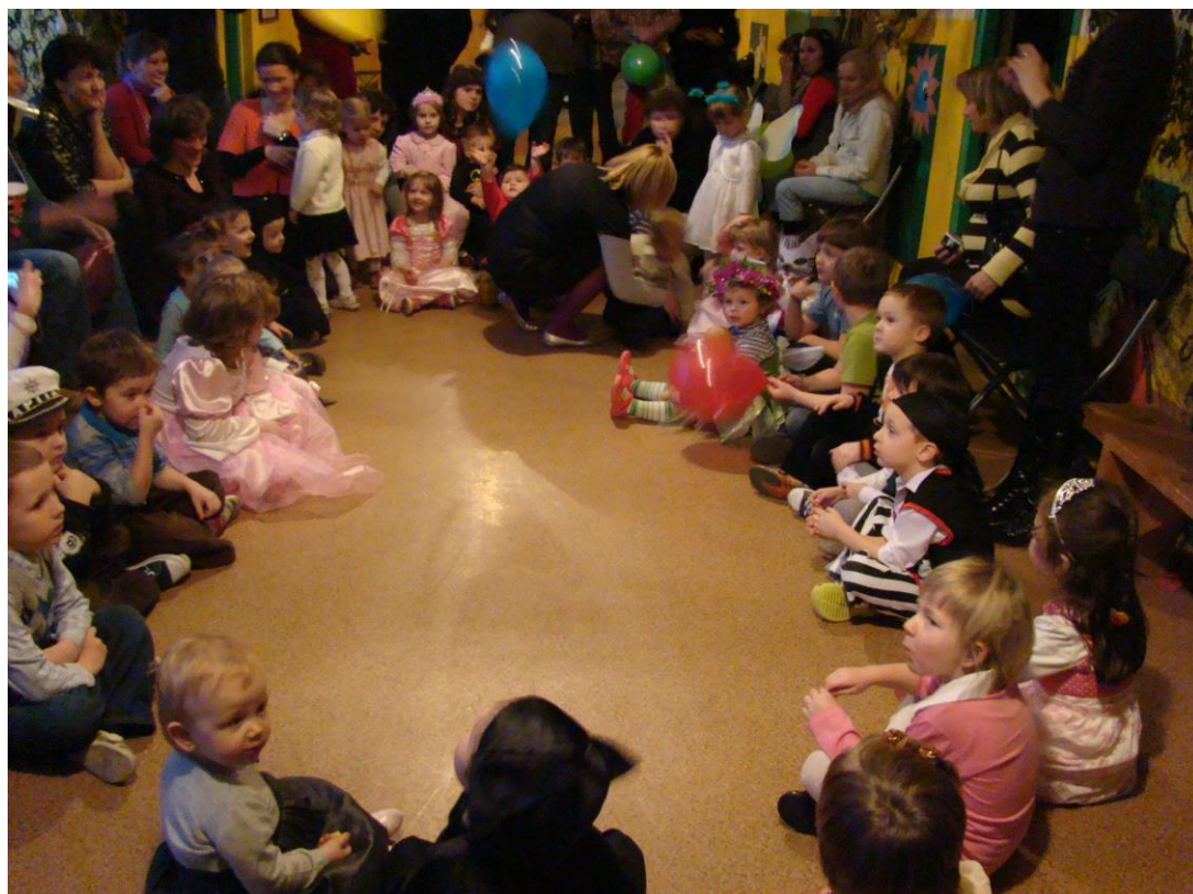
Fot. Bal karnawałowy

W budynku po Publicznej Szkole Podstawowej w Bądkowie oprócz Klubu Malucha postanie od 1 września 2022 roku Publiczne Przedszkole Samorządowe dla dzieci z całej gminy Goszczyn.