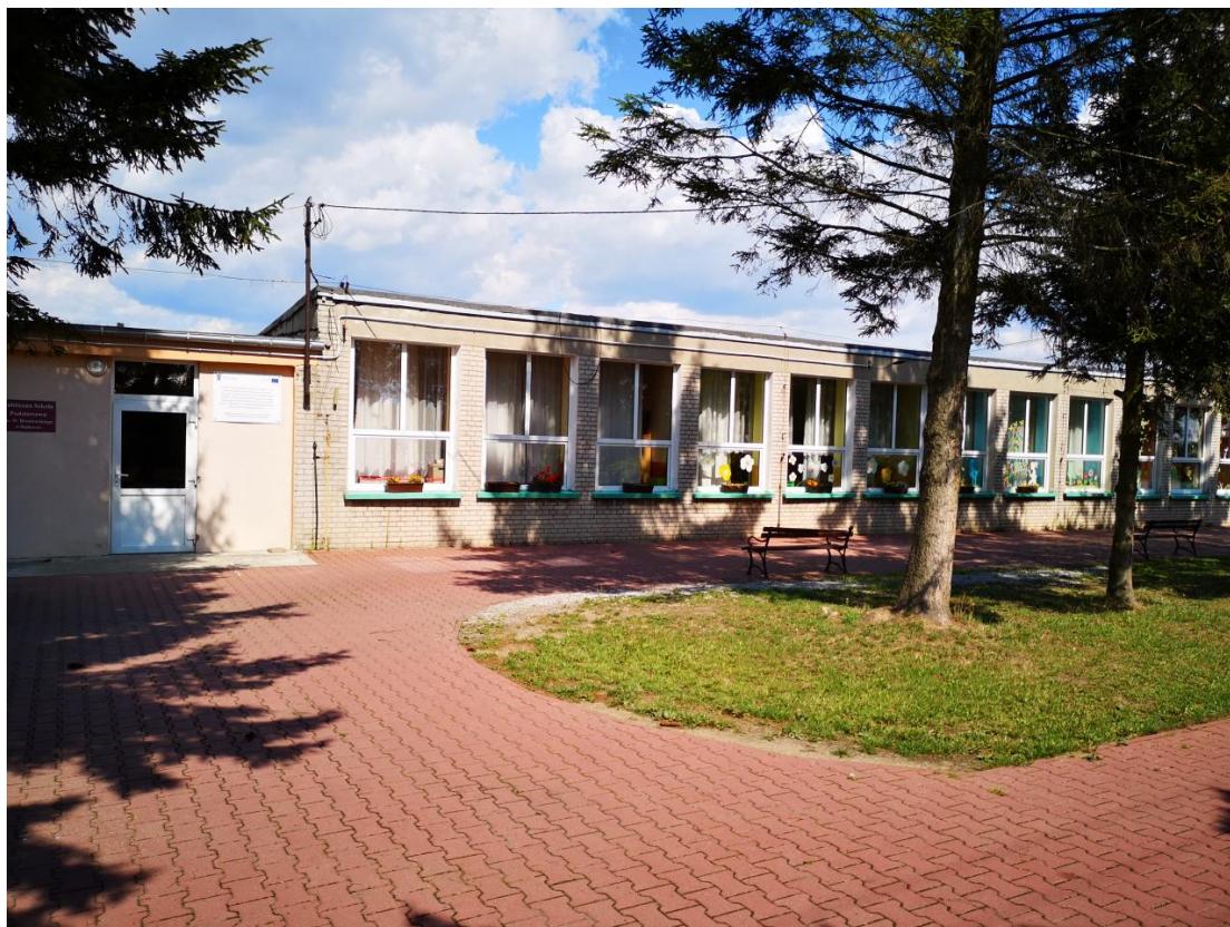
Fot.: Budynek PSP Bądków