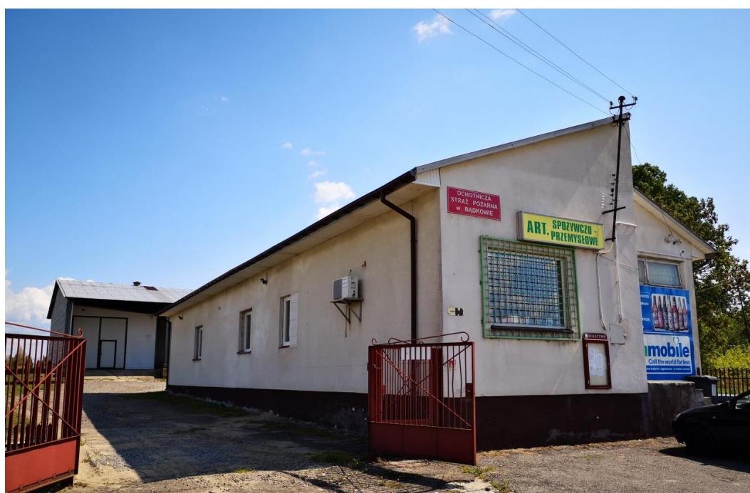
Fot.: Remiza OSP w Bądkowie

W ciągu ostatnich kilku lat Ochotnicza Straż Pożarna w Bądkowie wzbogaciła się sprzęt strażacki i umundurowanie zakupione z dotacji Urzędu Marszałkowskiego.