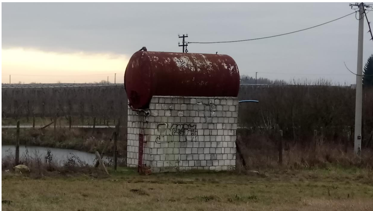
Fot. Ujęcie wody